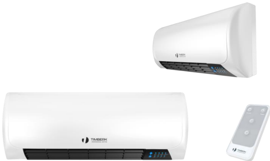
Пульт ДУ в комплекте